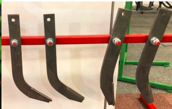
Från vänster till höger: