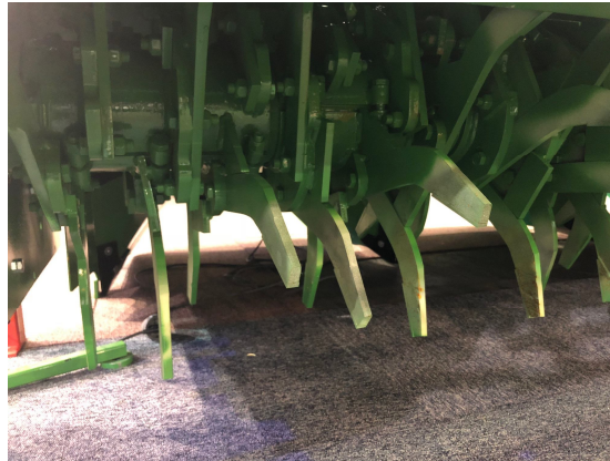
Höger Heavy Duty knivar